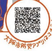
大阪市防災アプリはこちら