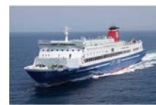
名門大洋フェリー