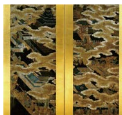
大坂城図屏風 (大阪城天守閣蔵)