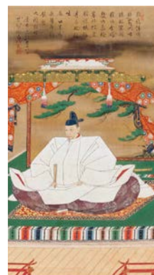
重要文化財「豊臣秀吉像」 慶長3年(1598)賛 京都・高台寺蔵