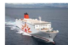
フェリーさんふらわあ