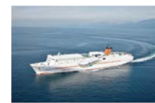
四国オレンジフェリー