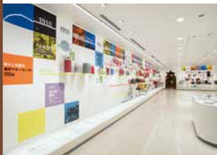
壁一面に色とりどりの魔法瓶が並びます

大阪は国産魔法瓶発祥の地。ガラス工業が盛んだった天満を中心に、大阪にガラス職人が集まり、大正時代からガラス製魔法瓶を全国に届けていました。