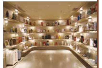
魔法瓶のランプで照らされた「まほうびんの森」

現在、WEBでは「バーチャルまほうびん記念館」を公開中。館内で流れる象印の歴史映像も観ることができ、大阪生まれのものづくりの魅力が楽しめます。※「まほうびん記念館」への来場には前日までに電話での予約が必要です