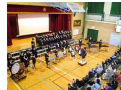
隔年で学習発表会または作品展