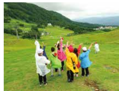
民間学習(八チ高原)