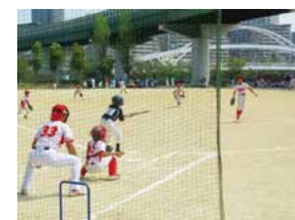
豊仁ジュニアソフトボール (ミニバスケットボール、ジュニアバレーボール)