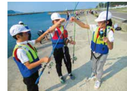
修学旅行(鳥羽・菅島方面)