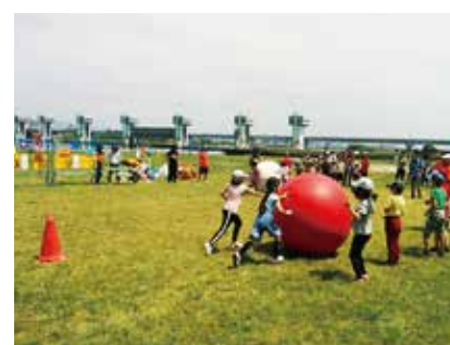
ワイワイサンデー