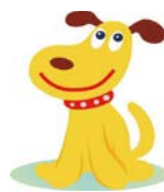
大阪市消費者センター メインキャラクター エルちゃん

4/1から成年年齢が満18歳に引き下げられ、未成年者に認められていた「契約取消権」がなくなります。特に18歳、19歳の方は契約前に内容をしっかりと確認しましょう。不安に感じたら一人で悩まず、気軽にご相談ください。消費生活相談は市内在住の方に限り、電話・面談・✉で行っています。