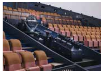
プラネタリウムホールの座席も刷新。よりゆったりと快適になりました