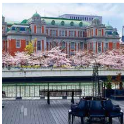
onishi08さん 「大阪市中央公会堂」