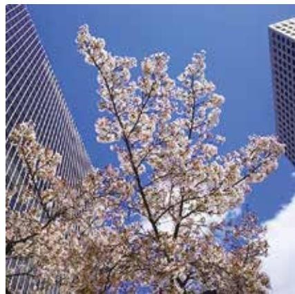
aozoracafe123さん 「大阪駅前第4ビル」