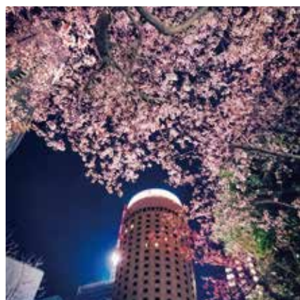
maxakichiさん 「大阪マルビル」