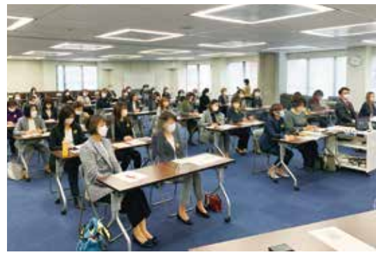
缶バッジを付けた第一生命保険株式会社の皆さん

北区の「こども110番運動」のマークは黄色と黒のデザイン。子どもを見守るサインです。まちで見掛けることが増えています。まちで行き交う歩行者や自転車、自動車等に「こども110番運動」マークを付けて「見守る目」になっていただこうと、北区は車両用のステッカー、自転車の前かごに付けるひたたくり防止カバー、缶バッジ等マーク入りグッズを広く配布してきました。今年度から新たにエコバッグも加わりました。 北区将来ビジョン「3か年計画」には、「こども110番運動」への協件件数が令和5年度に2万7千件という目標を掲げています。北区の人口の約20%に当たる数字です。令和4年3月末現在の協件件数は1万6千件です。 ● 若い世代も担い手に 若い世代にも「見守る目」になっていただくよう、専門学校等でも缶バッジの配布を始めました。その一つが上田女子服飾専門学校(芝田2)。生徒さんが、学校のロゴが入った黒いトートバッグに付けてくれました。入学式で全生徒に配られ、毎日のようにみんなが愛用している学校のシンボルです。生徒の皆さんが育った地域でも「こども110番運動」があったとのこと、認知度は抜群。見守られる側から、バッジを付けて見守る側へ、「安心安全なまちづくり」に若い世代も参加します。