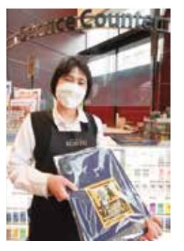
エコバッグは「KOHYO 南森町店」サービスカウンターで無料配布しています

● 企業も運動に協力 「こども110番運動」マークをデザインしたのはグループ校・大阪総合デザイン専門学校で生徒さんでした。 北区内にある企業からも「こども110番運動」を広げるためにご協力いただいています。 第一生命保険株式会社では、外交員の方々が、業務で区内を巡回する際に缶バッジを付け、「見守る目」を広げてください。 また、新登場のエコバッグは、スーパーマーケット「KOHYO南森町店(天神橋2)」のサービスカウンターで無料配布しています。 子どもを犯罪から守るためにスタートした「こども110番運動」を、高齢者や障がい者などまちで困っておられる方々にも目を配り、「気付きのある北区」をめざす活動に広げたいと、北区は様々な取り組みを進めています。ぜひ、ご協力ください。