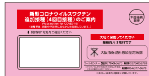
追加接種(4回目)のご案内