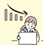
成績に影響が出たり...

A. 年齢に見合わない重い責任や負担を負うことで、自分の時間や勉強する時間、友人と遊ぶ時間が取れない、ケアについて話せる人がいなくて孤独やストレスを感じる、睡眠が十分に取れない、などの影響が出る可能性があります。