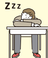
授業に集中できなくなったり...