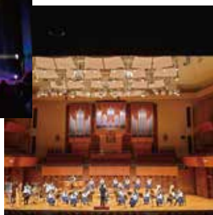
ゆめキタ音楽 フェスティバル♪