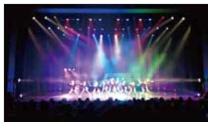
ドリームダンスカップ