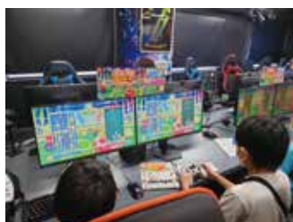
大阪キタでeスポーツ!