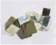
黄鉄鉱 (玄武洞ミュージアム所蔵)

2022年は世界鉱物年です。美しく、形のはっきりとした様々な鉱物標本を展示します。鉱物の持つ個性や魅力を楽しんでください。