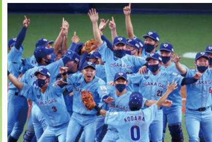
前回優勝チーム:大阪ガス

全32チームが出場し、社会人野球日本一を決定する最高峰の大会のチケットを500組1,000人にプレゼント。対象は市内在住・在勤・在学の方。詳しくは☎をご覧ください。