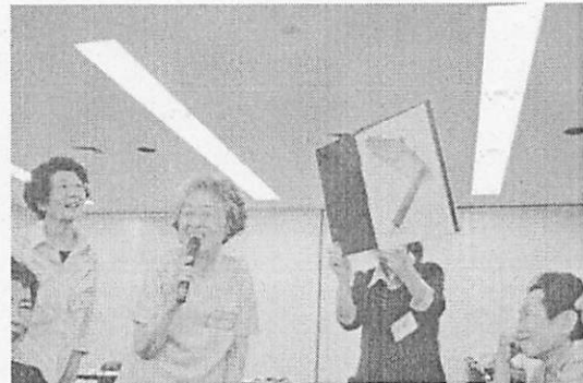
<完成した思い出の道具を発表します>