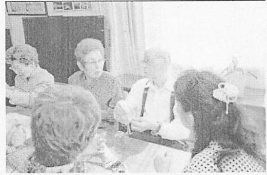
<メンバーの話に耳を傾けて聴きます>