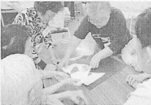
<グループでパズルを組み合わせます>