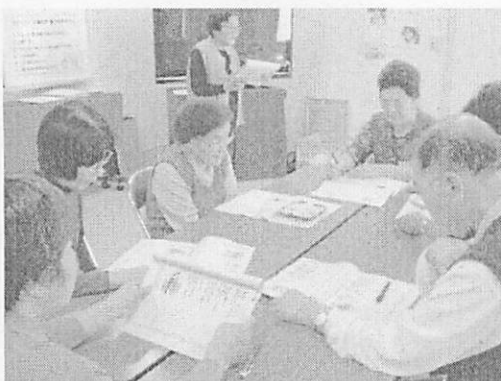
<歌集の中からグループで選曲します>