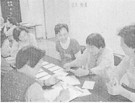
<カードのお題について話します>