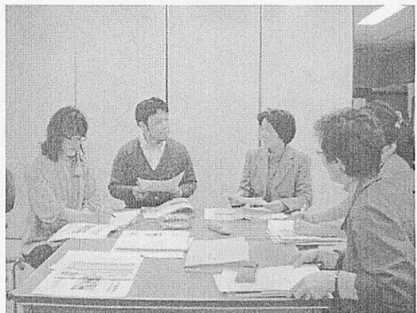
サポーター支援チーム会議の様子