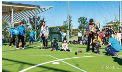
スポーツ体験(ポッチャ)の様子