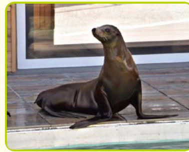
カリフォルニアアシカ