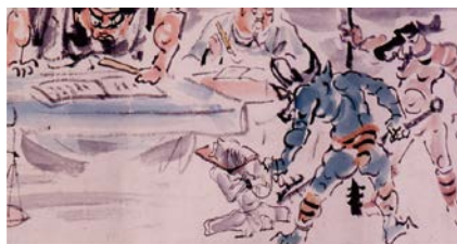
地こく変(部分) 菅橋彦筆 明治41年(1908) 大阪歴史博物館蔵

天変地異や災厄の原因を理解し、生の苦しみや死の恐怖を克服するために、人々は「異界」についてどのように捉え、交渉し、また対応してきたのかを民俗・歴史・考古・美術などさまざまな資料から考えます。