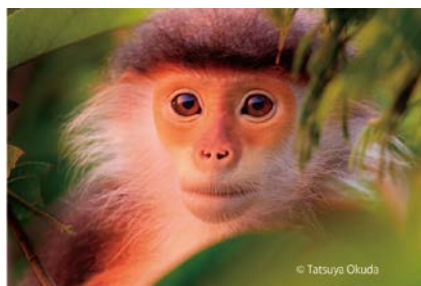
アカアシドゥクラングール

写真家の奥田達哉さんが東南アジアのジャングルで撮影した霊長類の絶滅危惧種の写真の中から、ユニークな約10種を20m以上にわたる壁面大型写真パネルで展示します。