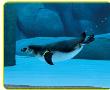
ファンボルトペンギン

¥ 入園料: 大人500円ほか 場問 天王寺動物園 ☎06-6771-8401 FAX06-6772-4633