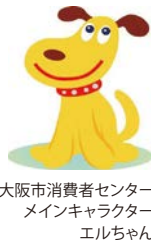
大阪市消費者センターメインキャラクター エルちゃん

「通信販売で健康食品を1回だけのお試しで購入したつもりが、定期購入契約になっていた」などのトラブルが増えています。不安に感じたら一人で悩まず、気軽にご相談ください。消費生活相談は市内在住の方に限り、電話・面談(事前予約制)・☑で行っています。 日 月~土曜10:00~17:00(祝日除く) 問 大阪市消費者センター消費生活相談専用電話 ☎06-6614-0999 FAX06-6614-7525