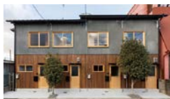
改修イメージ(改修前→改修後)