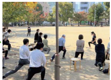
お昼休み☆20分ゆるゆるストレッチ