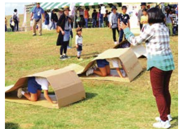
ダンボールキャタピラー

問い合わせ▶建設局調整課 ☎06-6615-6704 FAX06-6615-6070