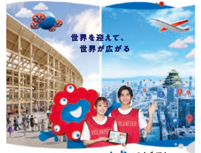
会場内での案内もまちなかでのおもてなしも

社会的な成功を夢見た女性たちを育て、大阪の文化的な土壌について考えてみませんか。