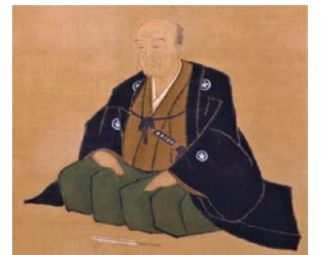
近松門左衛門像(部分)江戸時代(18世紀) 大阪歴史博物館蔵