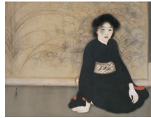
島成園《無題》大正7年(1918) 大阪市立美術館【通期展示】