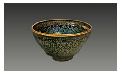
国宝 油滴天目茶碗 南宋時代・12-13世紀 建築 大阪市立東洋陶磁美術館 (住友グループ寄贈/安宅コレクション)

日 4/12(金)～9/29(日) 9:30～17:00 (入館は16:30まで)、月曜(祝日の場合は翌平日)休館(4/30は開館) ¥ 大人1,600円ほか 場 間 東洋陶磁美術館 ☎06-6223-0055 FAX 06-6223-0057