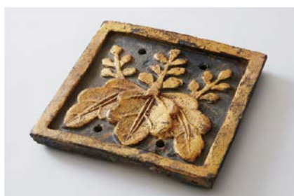
金箔桐文方形飾瓦 大阪市指定文化財 豊臣時代 大阪歴史博物館保管

豊臣秀吉が造った大坂城を象徴する金箔瓦や武家屋敷の屋根を飾った家紋瓦などの発掘資料を展示し、大坂城と城下町の姿を紹介します。