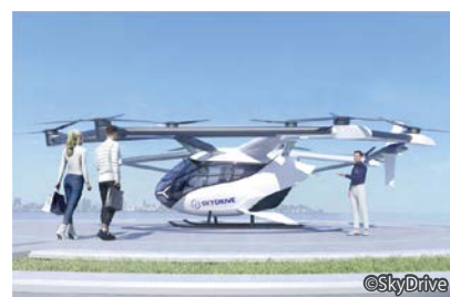
空飛ぶクルマの機体イメージ