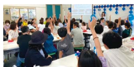
クイズ大会の様子

小学生を対象に、水に関するワークショップや体験型のイベント、謎解きなどを開催。定員各回70人。