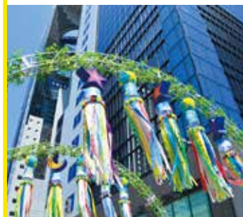
ウェルカムアーチの七夕飾り。夜にはライトアップも

18回目を迎える新梅田シティの「梅田七夕」。本場仙台からやってきた豪華な七夕飾りとともに、今年も仙台七夕を楽しむ企画が目白押しです。7月5日(金)〜7日(日)は、昭和レトロ商店街 滝見小路内郵便局前スペースの「仙台縁日」で、七夕関連商品や仙台名物の販売、吹き流し制作体験を開催。奥州・仙台おもてなし集団 伊達武将隊も登場します。この機会に是非足を運んでみてください。