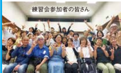
練習会参加者の皆さん

〈目標〉 10 人や国の不平等をなくそう 国内及び各国家間の不平等を是正する 《SDGsチャレンジ》 まずは手話に触れてみよう