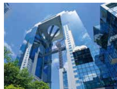
世界初の連結超高層建築は、空へ憧れる人々の幻想から着想を得た

地上40階建、世界初の連結超高層建築として1993年に誕生しました。2008年、英国タイムズ紙で「世界の建築トップ20」に選ばれて以来、外国からの観光客が急増。高さ173メートルの空中庭園展望台からの絶景を見ようと、日本人も含め年間約150万人が訪れる北区を代表するランドマークです。