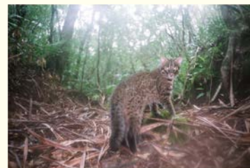
イリオモテヤマネコ

日 9/23(月・休)まで9:30~17:00(入場は16:30まで、月曜(7/15・8/5・12・9/16・23)は開館)、7/16(火)・9/17(火)は休館 場 自然史博物館 ¥ 大人1,800円ほか 問 大阪市総合コールセンター ☎06-4301-7285 FAX06-6373-3302