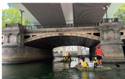
手漕ぎボート体験の様子

浄水場や下水処理場の施設見学、手漕ぎボートによる東横堀川の周遊体験を通して「水」について学びます。対象は市内在住または在学の小学生とその保護者(1組4人まで)。定員80人。昼食・飲み物は持参してください。