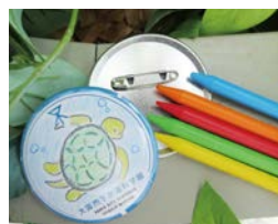
缶バッジ作品イメージ

オリジナルのマンホールふたをデザインして、世界に一つだけの缶バッジを作ろう。マンホールの役割やデザイン、暮らしと下水道の関係も学べます。定員各回100人(先着順)。 ☎ 9/22(日・祝)・23(月・休) 10:30～14:00～ ☎ 場 問 下水道科学館 ☎ 06-6468-1156 FAX06-6468-1160