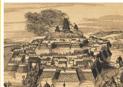
ヨーロッパに紹介された豊臣大坂城の炎上(部分) (モンタヌス「日本誌」より、大坂城天守閣蔵)

石山本願寺合戦、大坂夏の陣、戊辰戦争といった主要な戦いが起こるたびに大坂城は炎に包まれました。本展では、大坂城焼失と戦場で命を燃やした人物ゆかりの資料を紹介します。 ☎ 10/9(水)まで9:00～17:00(入館は16:30まで) ☎ 入館料：大人600円 ☎ 場 問 大坂城天守閣 ☎ 06-6941-3044 FAX06-6941-2197