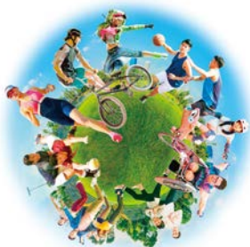
OSAKA NEXPO 2024

バーチャルスポーツ体験やミャクミャクとダンスを踊るプログラムなど、誰もが楽しめるスポーツ体験イベントを実施します。 ☎ 9/13(金)～16(月・祝) 11:00～21:00 ※最終日は18:00まで ☎ 場 大阪城公園 太陽の広場(YATAIフェス会場内) ☎ OSAKA NEXPO 2024事務局 ☎ 06-6221-5931 FAX06-6221-5938