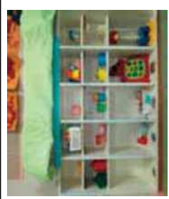
ままごとと 玉落とし ポットン カップ