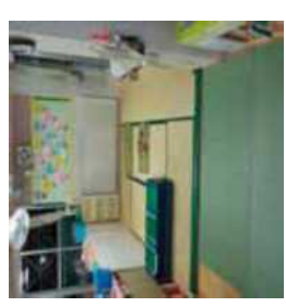
汽車・ブロックコーナー 午睡 コーナー