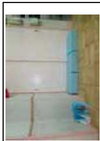
トイレ用タオルフック 着替え用椅子