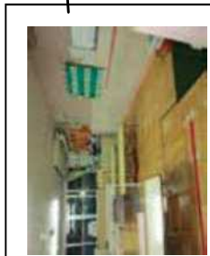
食事・制作コーナー