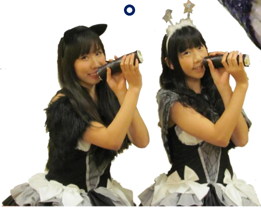
自称 西原此花区長の付き人「ぶり☆でび」