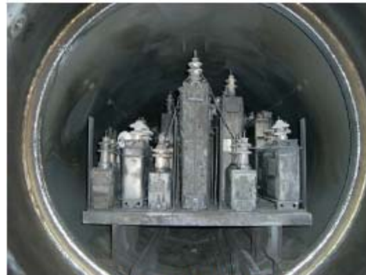
(紙を絶縁紙に使用したコンデンサの処理後)

○このため、あらかじめPPコンデンサ等を鋼製ケースに入れて処理を行う必要があり、 著しく処理効率が悪い 。