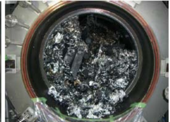
(ポリプロピレンを使用したコンデンサの炉内破裂した際の状況)