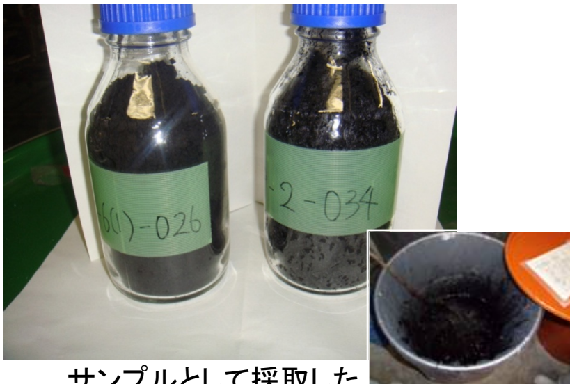
サンプルとして採取した PCBを吸着した粉末活性炭