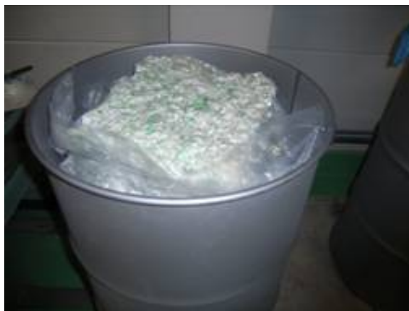
化学防護服(破碎済み)