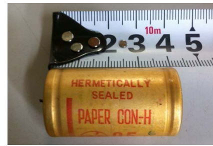
家電製品用コンデンサ