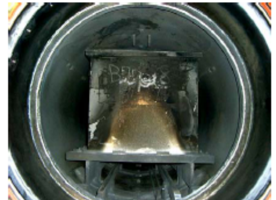
(鋼製ケースに入れての処理)