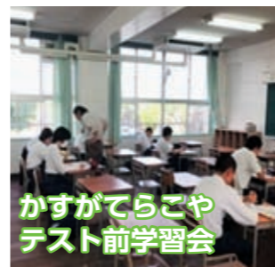
かすがてらこや テスト前学習会