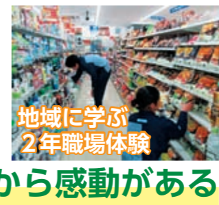
地域に学ぶ 2年職場体験