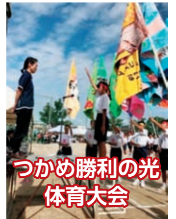
つかめ勝利の光 体育大会