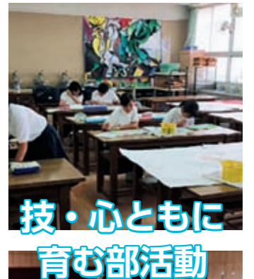
技・心ともに 育む部活動