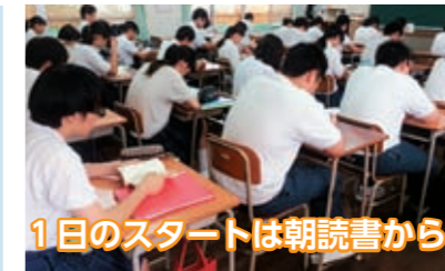
1日のスタートは朝読書から

一人ではできないことも、みんなの力をあわせればできる！ 一人ひとりの個性をいかしながら、集団の持つ力で、生徒をより大きく成長させていきます。