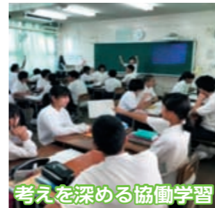
考えを深める協働学習