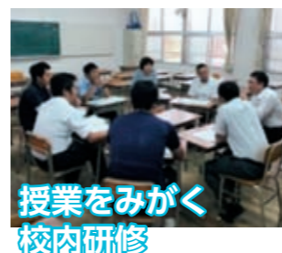
授業をみがく 校内研修