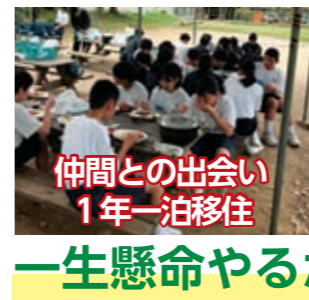
仲間との出会い 1年一泊移住