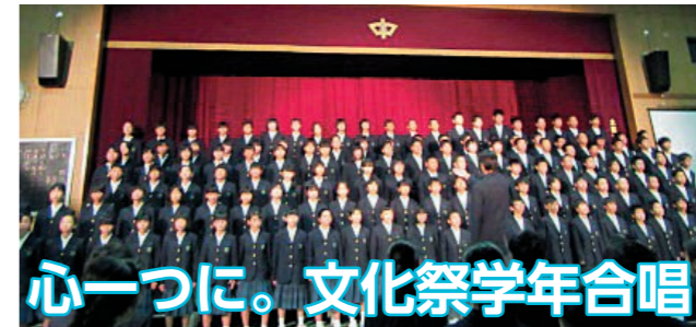
心一つに。文化祭学年合唱