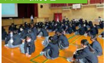
キャリア教育学習 (SPトランプ)