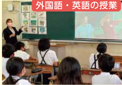
外国語・英語の授業