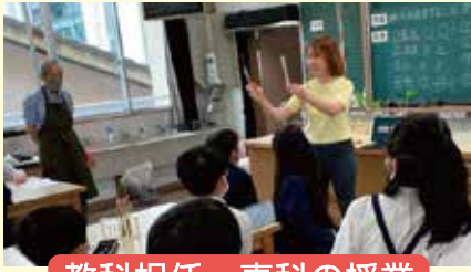
教科担任・専科の授業