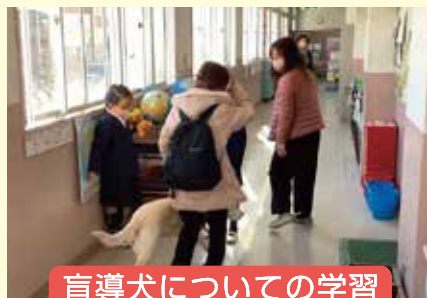
盲導犬についての学習