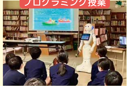
プログラミング授業