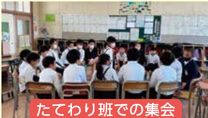
たてわり班での集会