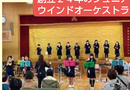
創立24年のジュニア ウインドオーケストラ