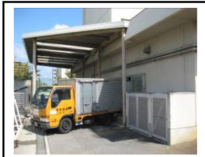
木太北部小学校調理場・配送車待機状況 (配送車は調理場横に停車)