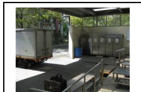
配達車到着1(配善室横に停車)