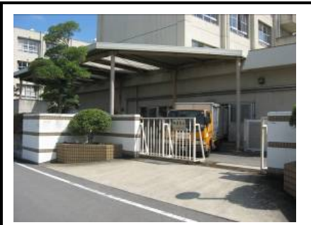
配送車停止位置(調理場横まで配送車が 進入している。)