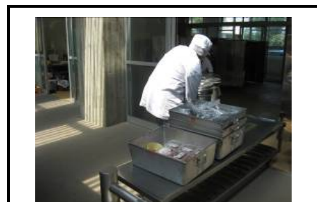
搬入風景(運転手と配膳員が手分けして)