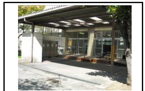
玉藻中学校配善室全景(配送車がすぐ横に 停車できるよう設計されている。)