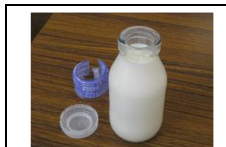
牛乳ビン(蓋はプラスチック製・再利用する)