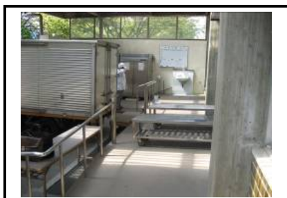
配達車到着2(配善室横に停車)