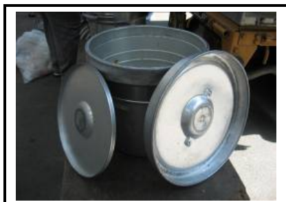
保温食缶(2重中空構造)