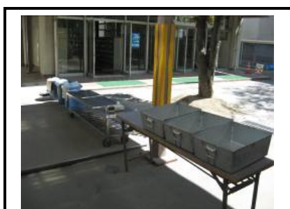
残菜・食器返却体制(配善室前でバット等を並べる)