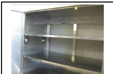
配膳棚内部(3段構造)