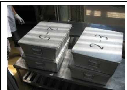
主食食缶(保温機能なし)