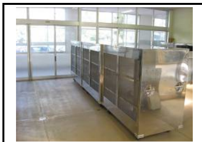
配膳棚裏面(メッシュ構造で通気性を確保)