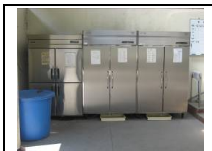
牛乳保冷库(配善室脇に設置)