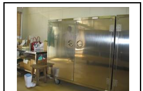
配膳棚(移動式の錠付ボックスタイプ、保温 保冷機能なし)