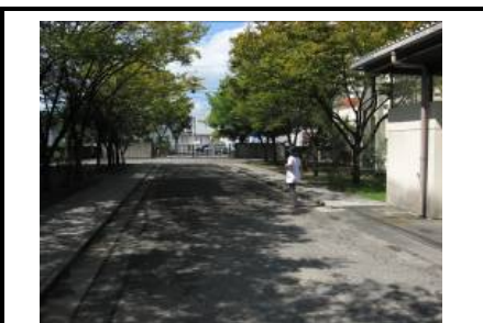
玉藻中学校・配送車搬入路(配送車が配善 室横まで進入できる)