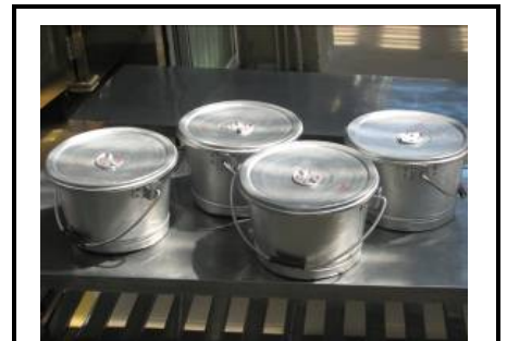
副食食缶(保温機能なし)