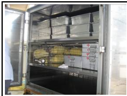
配送車内部(内部は食缶等のサイズに 合わせて棚を配置)