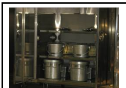
搬入完了(食缶等の種類ごとに配置)