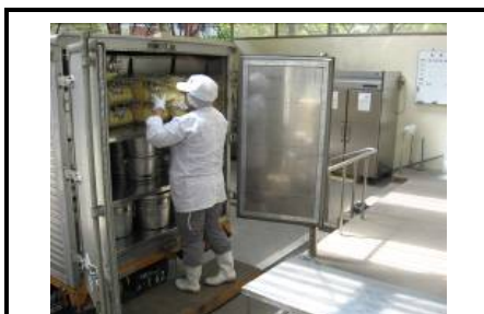
到着、配達員が作業開始