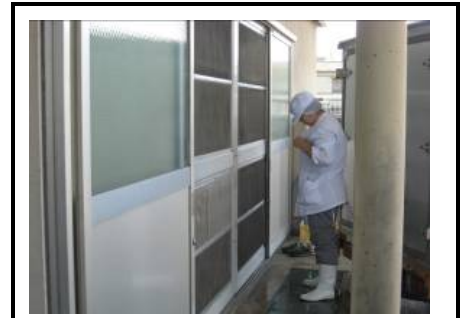
配送員待機状況(給食が配善されるごとに 順次積み込み。調理場と配送車の扉は その都度閉めて待機)