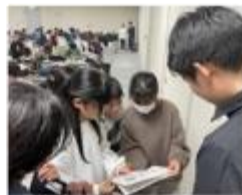
課題を確認するため 社員の方にインタビュー