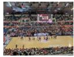
来場者数の増加を達成