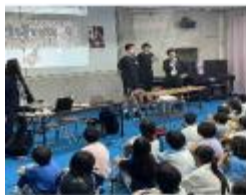
来場者を増やすには？ という問いを設定