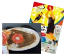
課題解決に向け友達と話し合い、アイデアを商品化