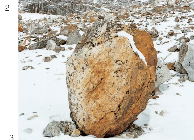
1 BROAD PEAK 2 K2 3 CHO-OYU