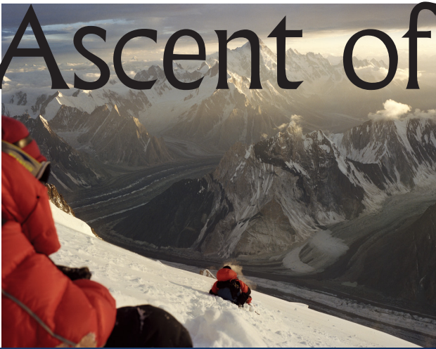
Ascent of 14 2001-2024

ぼくは確かにこれらの場所に立ち、写真に写っている風景を見た。これは理屈じゃない。ここにある写真群は、小手先の表現などではなく、まごうことなき自分の生の記録である。30年間にわたって地球上のあらゆる地域を旅してきた。中でも、ヒマラヤに通った日々は最も濃密な体験/経験として身体の奥底に沁みこんでいる。忘れるわけがないのだが、しかし、記憶はどうしても薄れる。両手で丁寧にくっつけた水は、それがどんなに大切な水だとしても、いつしか指の隙間からこぼれ落ち、最後には感触しか残らない。忘れたくない。あの苦しさと喜びを忘れたくない。いくつもの出会いと別れを忘れたくない。だから、ぼくはつづきに写真を撮った。ここにあるのは、自分が死ぬまで、暗闇を照らし続ける光源のような日々の記録である。