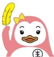
法務省マスコットキャラクター 更生ペンギン「サラちゃん」