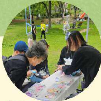
物販・ワークショップ