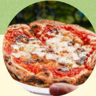
屋台・キッチンカー