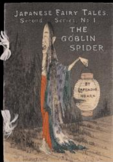
【上】ヘレン像(右横顔) 小泉清筆 昭和25年(1950) 小泉八雲記念館蔵 【下】『日本お伽草子 化け蜘蛛』 明治31年(1898) 近畿大学中央図書館蔵