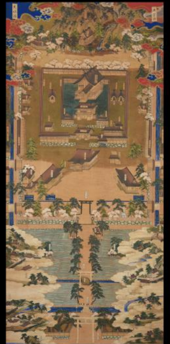
出雲国大社図 江戸時代 島根県立古代出雲歴史博物館蔵