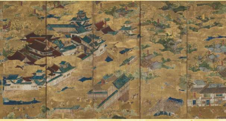
聚楽第図屏風 桃山時代 16世紀 東京・三井記念美術館蔵 [前期展示] 聚楽第築城から間もない頃に制作されたと考えられます。聚楽第は秀吉の天下を示す城であるが、その様子を伝える貴重な作品。