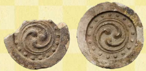
郡山城跡出土瓦 16世紀 奈良・大和郡山市蔵 [通期展示] 大坂城跡出土瓦 16世紀 大阪市教育委員会蔵 [通期展示]