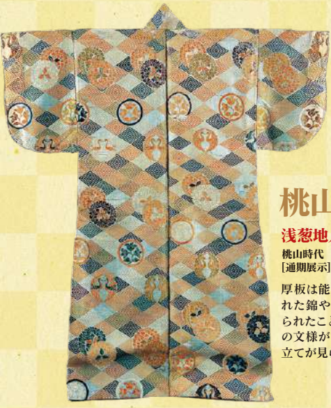
桃山ファッション 浅葱地入子菱花丸紋散模様厚板 桃山時代 16～17世紀 東京・国立能楽堂蔵 [通期展示] 厚板は能装束の一つで、中国から舶載された錦や唐織など厚手の織物で仕立てられたことからの呼び名です。色とりどりの文様が織り出され、桃山時代特有の仕立てが見られます。