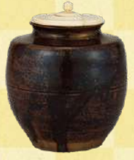
肩衝茶入 銘 薬師院 中国・南宋～元時代 13～14世紀 兵庫・香雪美術館蔵 [通期展示] 秀長所用と分る唯一の茶入で、天正15年(1587)正月に大和郡山で行われた茶会では、秀長がこの茶入を用いたことが知られています。