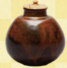
唐物茄子茶入 付藻茄子 大名物 中国・南宋～元時代 13～14世紀 東京・静嘉堂文庫美術館蔵 [8月19日～8月31日展示] 松永久秀が織田信長に献上したことで大和一国の領地を安堵されたとも伝わっています。秀吉・家康と時の天下人が所持しました。