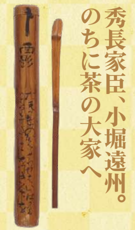
竹茶杓 歌銘 面影 江戸時代 17世紀 愛知・徳川美術館蔵 [通期展示] 大名茶人として知られた小堀遠州(正一)の作。和歌に因んで名付ける歌銘は、小堀遠州が創始したとされています。遠州は、王朝時代の幽玄と中世の侘びとを融合させた新たな美意識である「綺麗さび」を確立しました。

秀吉の大坂城と秀長の郡山城から、同じ型で作られたとみられる瓦が出土しました。兄弟が瓦を生産する道具や仕組みを共有していたことが推測できます。