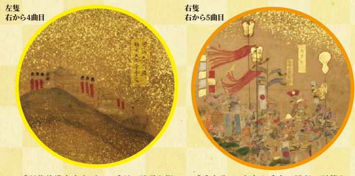
左隻 右から4曲目 「羽柴美濃守之」とは、秀長の陣営を指し示しています。 右隻 右から5曲目 「秀吉公」の文字や秀吉の馬印の瓢箪を見つけることができます。