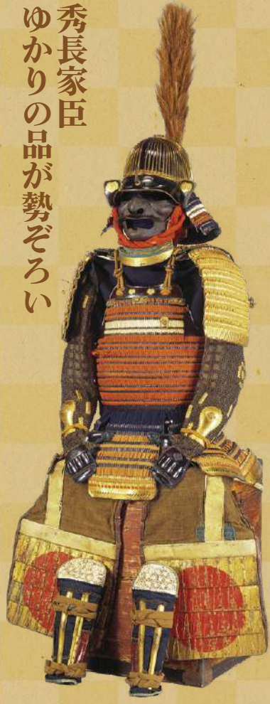
紅糸胸白威二枚胴具足 江戸時代 17世紀 大阪城天守閣蔵 [通期展示] 藤堂高虎が大坂冬の陣で着用した具足で、胸板や兜の吹返には藤堂家の鳥紋があしらわれています。