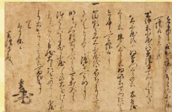
羽柴秀吉書置 羽柴秀長宛 天正11年(1583)3月晦日 滋賀・長浜城歴史博物館蔵 [7月8日～7月27日展示] 賤ヶ岳合戦の際に秀吉から秀長に送られた書状です。前線の指揮を執る秀長に対して、秀吉が細やかな指示を与えています。