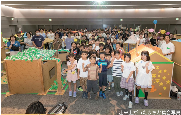
出来上がったまちと集合写真