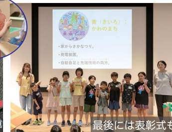
最後には表彰式も

毎年恒例となりました、夏休みの小学生向けワークショップです。 ダンボールを使ってホールいっぱいに大きな“まち”をつくります。 ものづくりの楽しさを一緒に体験しましょう！