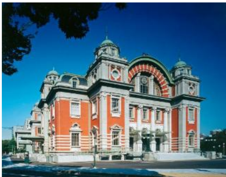
大阪市中央公会堂