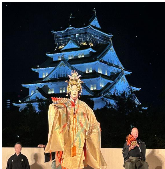
薪能（大阪城西の丸庭園で公演）