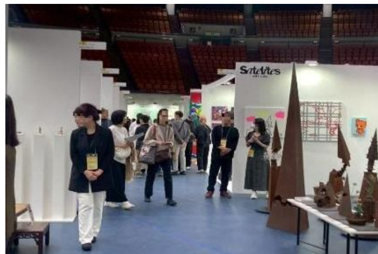
OSAKA INTERNATIONAL ART（大阪城ホールでのアートフェア）