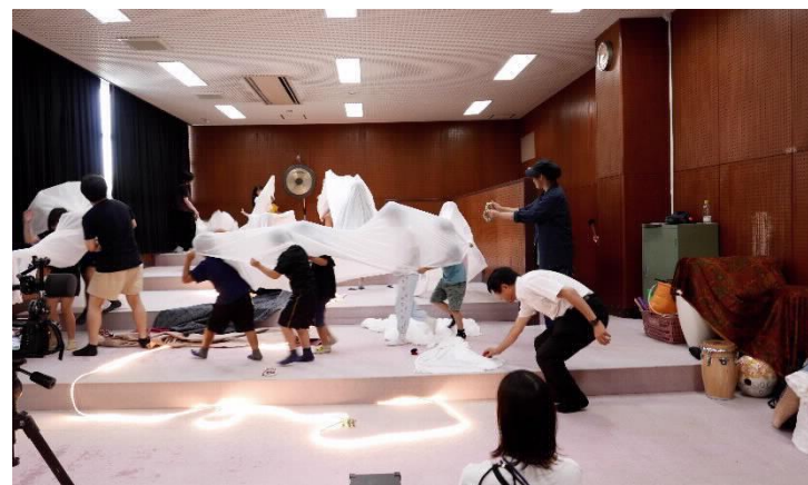
Equity&Justiceを軸としたソーシャルアート コーディネーターの育成（人材育成講座）