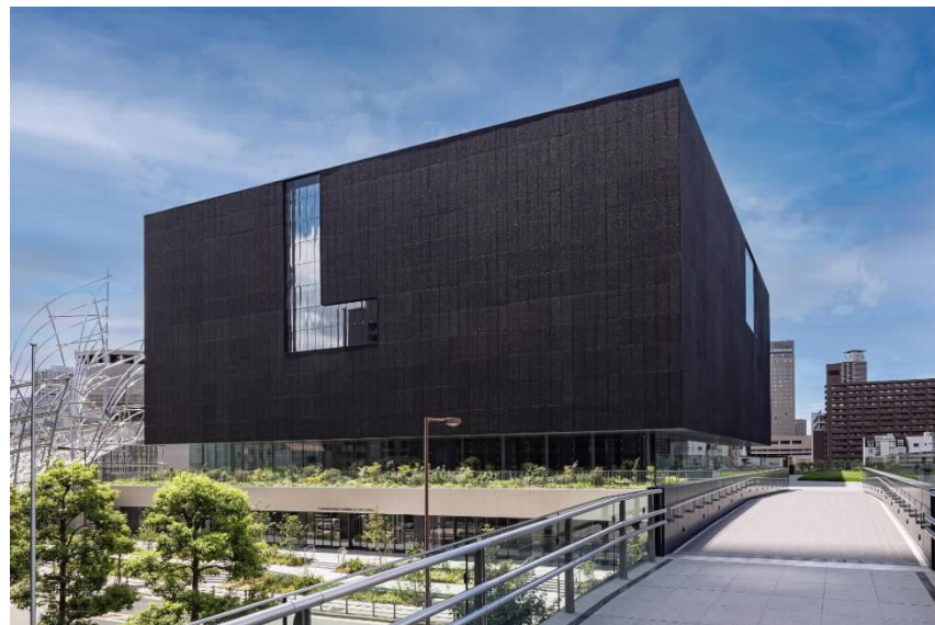
大阪中之島美術館