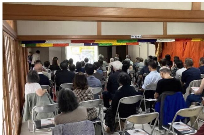
文学碑の集い（講演会）