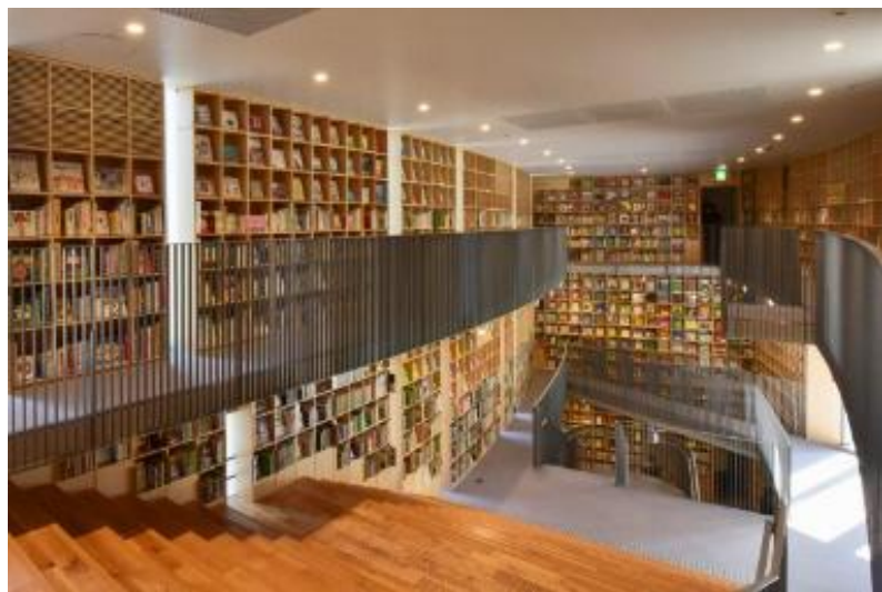
こども本の森中之島（内部）