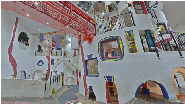
子供の街：4階から5階まで吹き抜けのキッズプラザ大阪のメイン施設