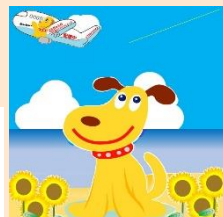
メインキャラクターエルちゃん