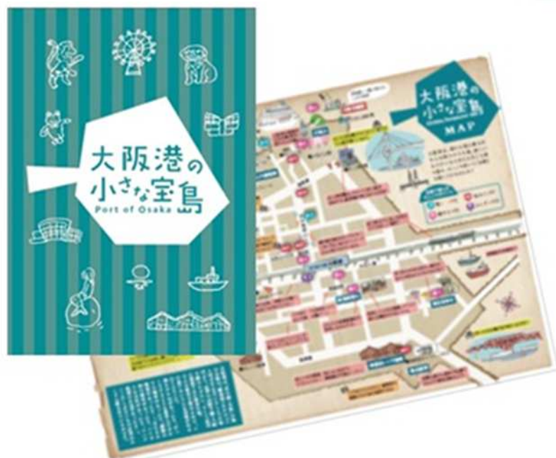
ガイドブック「大阪港の小さな宝島」 の作成・配布