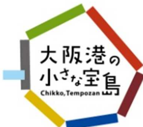
魅力発信のシンボル となるキャッチ コピーとロゴ