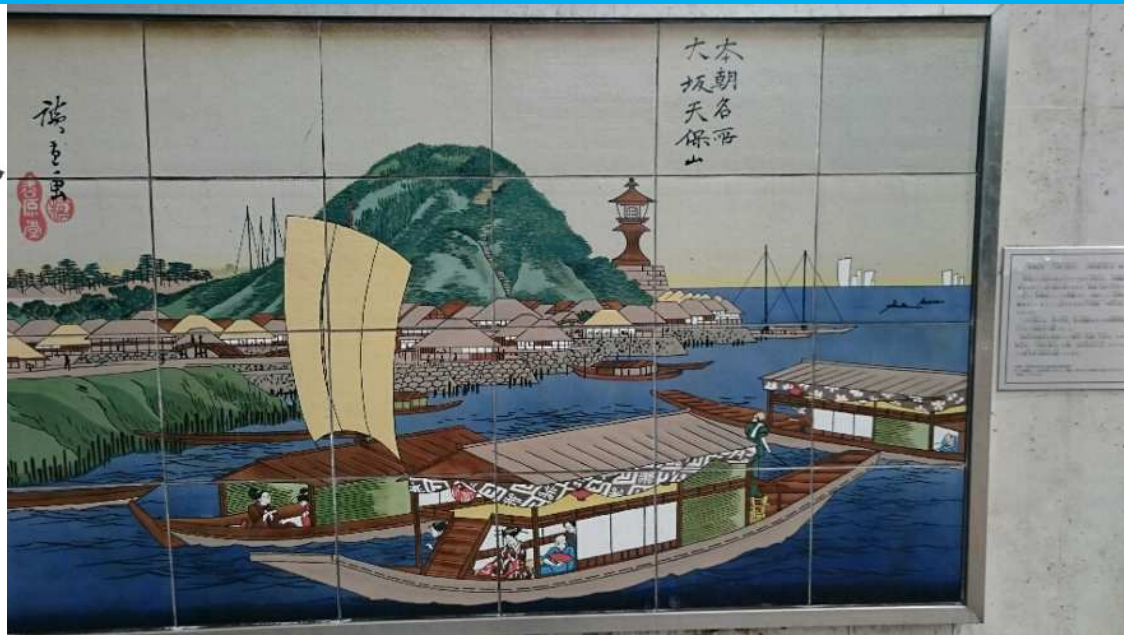
天保山公園 入口の陶板（既存） 天保山のにぎわいの象徴 江戸時代「浪花の新名所」