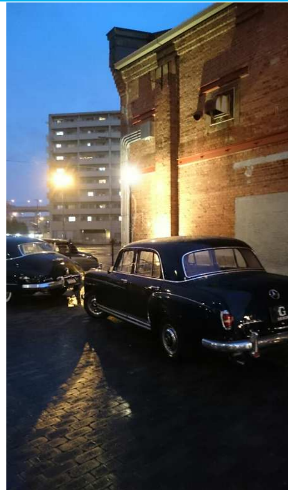
9月6日赤レンガでジャズライブ「ダブルクラシック」