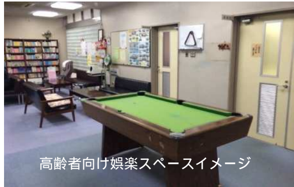
高齢者向け娯楽スペースイメージ