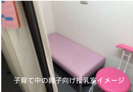
子育て中の親子向け授乳室イメージ