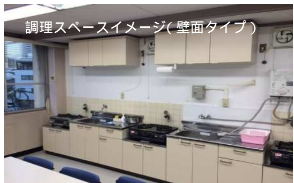
調理スペースイメージ(壁面タイプ)