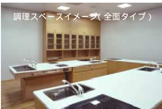
調理スペースイメージ(全面タイプ)