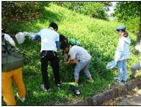
□ こどもたちが虫を見つけたようです！！