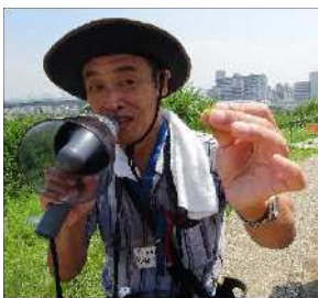
□ 中谷先生から一言「いつもこどもたちの元気には、圧倒されています。」