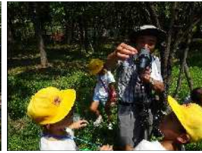
□ 中谷先生がトンボの説明をしています。