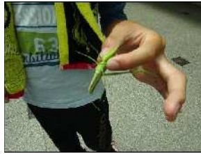
□ 捕まえたバッタを見せてくれました。