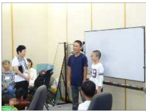
□ こどもたちから「ありがとうございました！！」とお礼の言葉がありました。