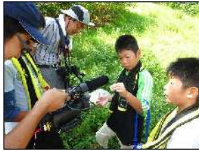
□ 見つけた虫は茶色のカマキリでした。ケーブルテレビの取材を受けています。