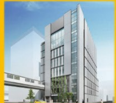
完成予想図のため、実際と異なる場合があります。

完成が計画より遅れることにつきましては、区民の皆さまに対して大変心苦しいことですが、港区のまちづくりのあゆみを後世に伝えるとともに、広く区民の皆さまに貢献し、今後の港区のまちづくりに役立つ公共施設となるよう引き続き全力をあげて取り組んでまいりますので、ご理解いただきますようお願いいたします。