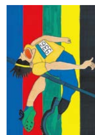
令和2年度障がい者週間のポスター小学生部門最優秀賞作品

障がいのある人とない人との心のふれあいをテーマにした作文またはポスター。対象は市内在住または在学の①小学生以上②小・中学生。申込方法など詳しくは⑳をご覧ください。 ㉗ 9/3 ㉘ 福祉局障がい福祉課 ☎ 6208-8071 FAX 6202-6962