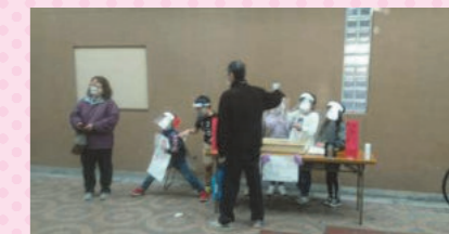
3年生「キッズ・マーケット」