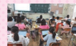
一人一台端末を使って