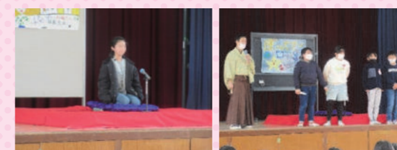
5年生「落語をつくろう」