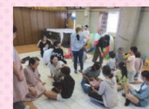
6年生「赤ちゃんとおそぼう」