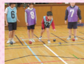
4年生「ボッチャ体験」