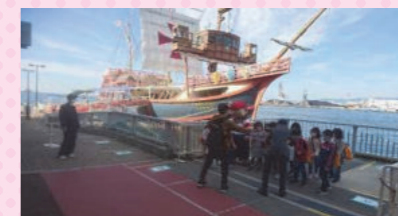
2年生「海遊館とサンタマリア号」