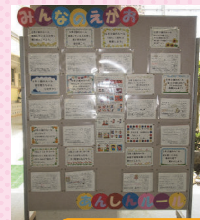
みんなの笑顔・安心ルール