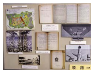
過去の展示の様子

市の歴史や市政に関する理解を深めていただくため、明治から昭和初期に市が主催・後援した博覧会と市の近代都市化について、所蔵する公文書と刊行物を通じて紹介します。ぜひご来館ください。