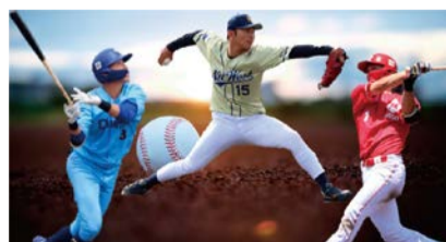
大阪ガス、NTT西日本、日本生命の野球部