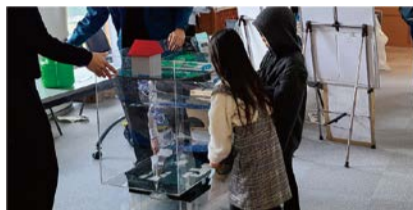
模型による体験の様子